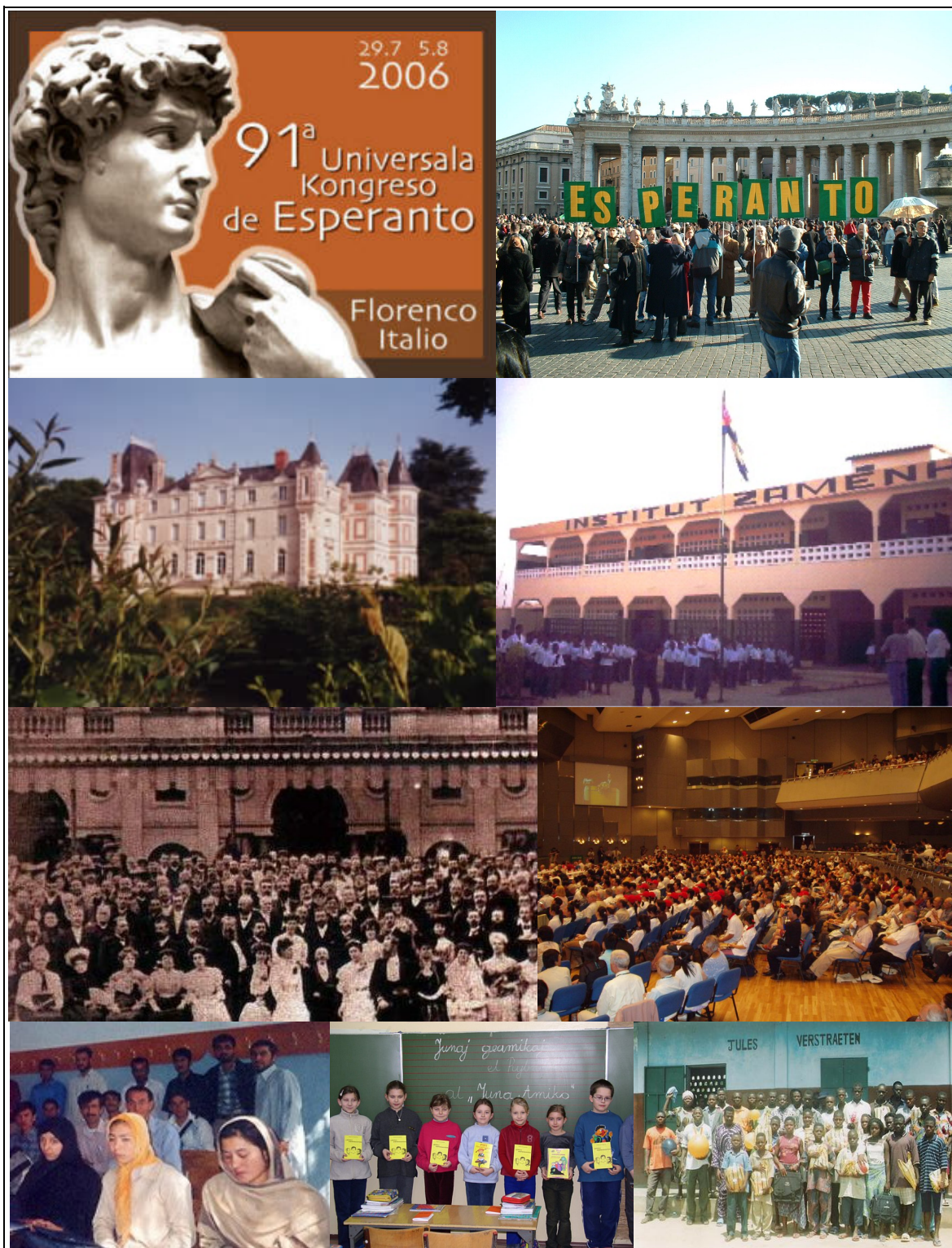
Figura 9: 91º Congresso Universal de Esperanto (Florença, 2006); esperantistas na Praça de São Pedro; Centro de Esperanto no Chateau Grésillon (França); Instituto Zamenhof (Togo); primeiro Congresso Universal de Esperanto (Boulogne-sur-Mer, 1905); público presente à abertura do último congresso universal; cursos no Afeganistão, na República Tcheca e em Benin.