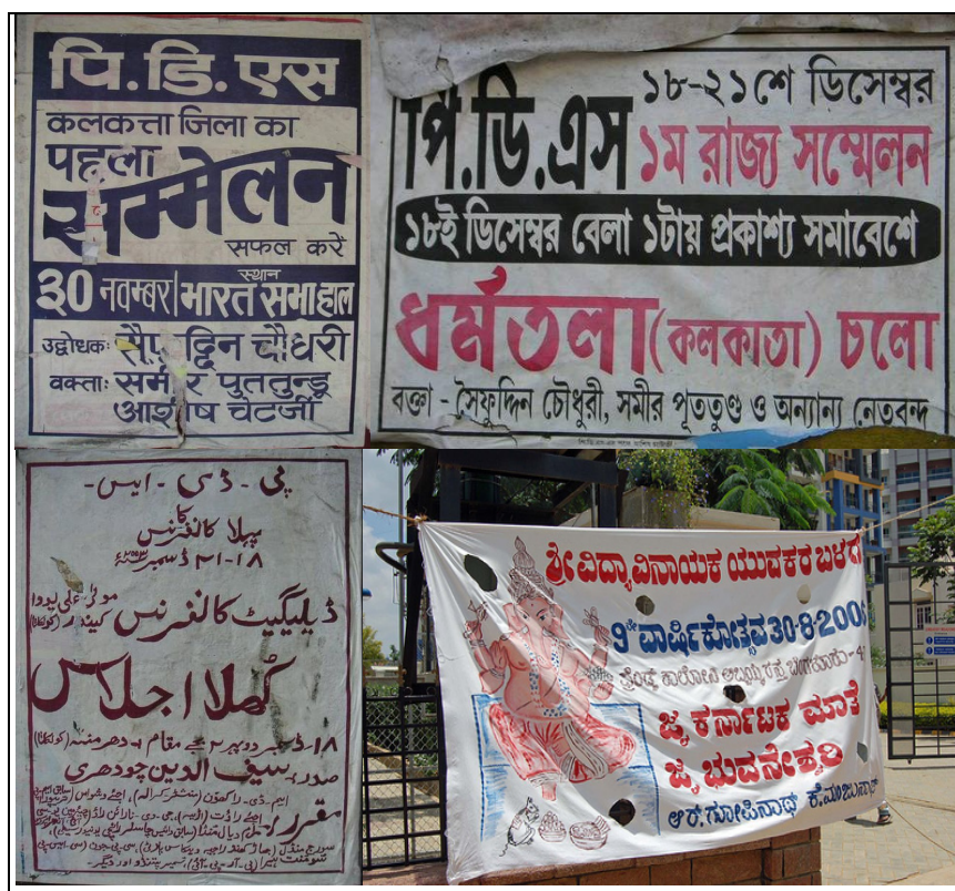
Figura 11: Diversidade de línguas na Índia: cartazes em hindi, bengali, urdu e kanada.

Embora o esperanto tenha alguns falantes na Índia, graças principalmente ao apoio que lhe havia sido dado pelo escritor bengali Rabindranath Tagore, eles estão perdidos na enorme massa da população, e, dispersos e pobres, não estão em condições de exercer o menor impacto sobre a opinião dos políticos. É uma pena. Aquele que viu como funciona o esperanto, e em particular a rapidez com a qual ele poderia ser aprendido por pessoas de todas as línguas e de todas as culturas, não pode se impedir de dizer-se que ele traria à Índia uma solução realmente satisfatória para aquilo que, sem ele, será sempre a quadratura do círculo: como se compreender mutuamente sem se enfeudar em uma dada cultura?