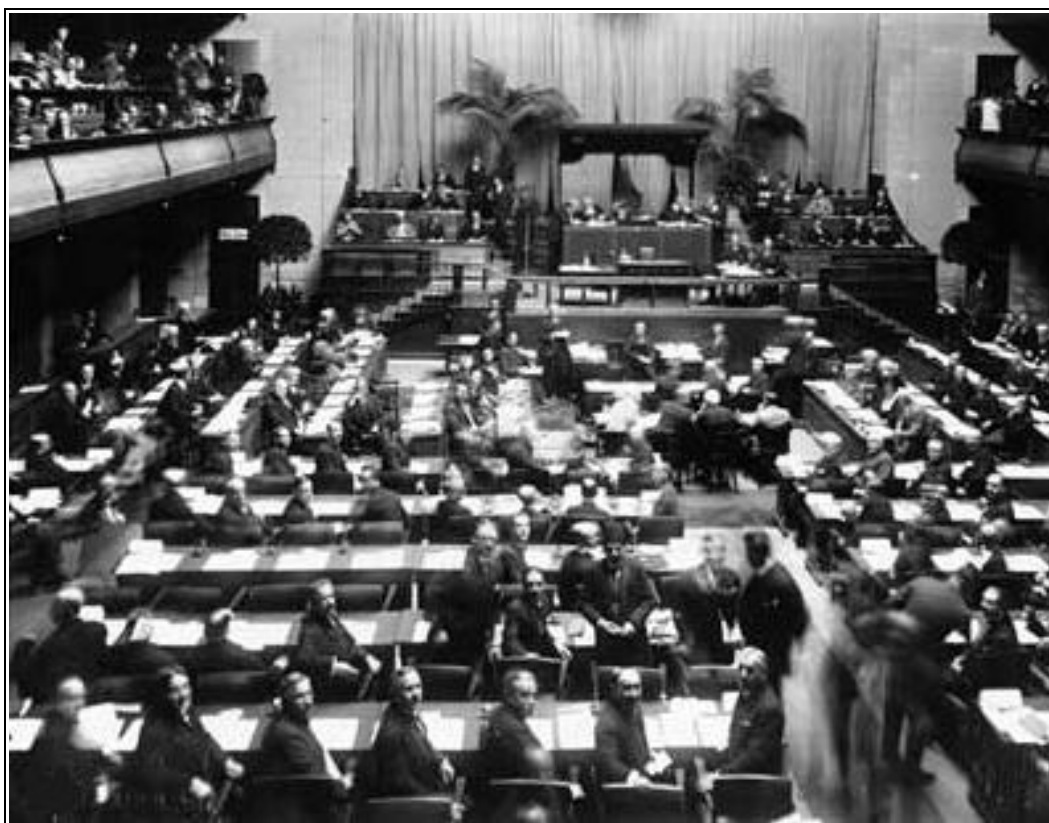
Figura 7: Plenário da Sociedade das Nações em 1920

A solução preconizada para curar o mundo da síndrome de Babel consistia em distinguir os níveis de comunicação. Constatando que as línguas nacionais não eram adaptadas ao uso internacional, o Secretariado da SDN propunha escolher para aquele uso um remédio específico, uma língua-ponte. A justiça, a eficácia, o respeito de cada cultura só tinham a ganhar com isso. Ora, o estudo da SDN estabelecia que... É melhor não, não seria justo apresentar o remédio dessa maneira, às escondidas, como uma sombra, em fim de capítulo. Ele merece ser colocado bem no centro do palco, sob uma iluminação que lhe realce plenamente o valor, sob a condição de provocar um zumzumzum na platéia ou de ter o efeito de uma bomba. Baixem as cortinas, então. E paciência. As cortinas vão se abrir em um novo ato, aquele no qual a intriga se estabelece verdadeiramente: o capítulo 7.