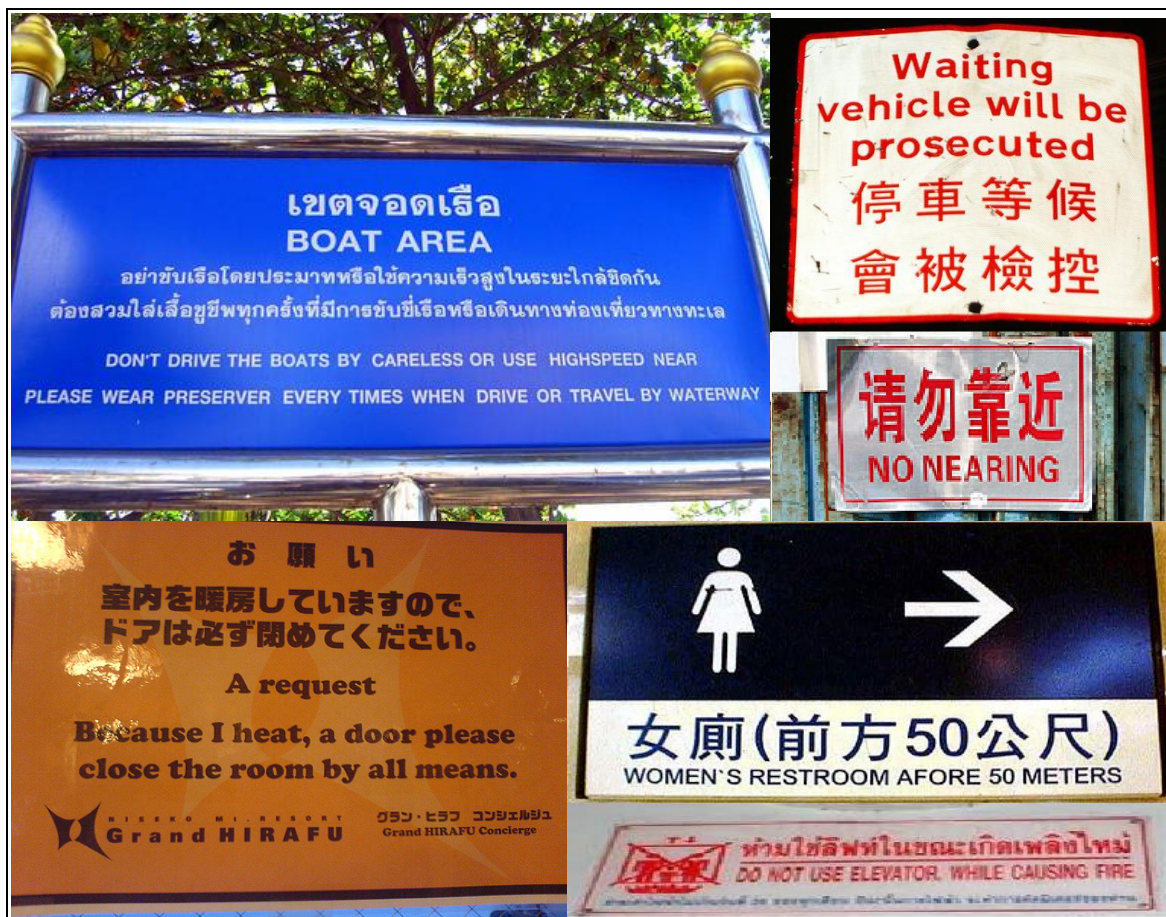
Figura 5: Placas em pseudoinglês

Por vezes ocorre que um aviso em pseudoinglês não revele humor involuntário, mas aumente ligeiramente os riscos para a segurança. Por exemplo, num trecho da auto-estrada Lyon-Genebra, no início de um forte declive, pode-se ler: Utiliser le frein moteur. Use engine braking . O anglo-saxão que lê essa frase não a compreende imediatamente. Em inglês, os brakes são os freios, e nada têm a ver com o motor. To brake ou braking significa, não “reduzir”, mas “apoiar o pé no pedal dos freios”. Curiosamente, a boa tradução encontra-se em um outro trecho da mesma auto-estrada: Engage low gear , quer dizer, “engrene uma marcha mais lenta”. Algumas vezes, a mensagem não é passada, não porque a língua está incorreta, mas porque ela é de um nível não apropriado se endereçada a estrangeiros. Vêem-se em algumas auto-estradas painéis que dizem: Moderez votre allure . É excelente francês. Mas raros são os estrangeiros que, sabendo relativamente bem nossa língua, compreendem esse conselho. As palavras mais bem entendidas por um estrangeiro são as mais usuais. Após um ano de francês, muitos compreendem a expressão Allez plus lentement . Não é senão no decurso do segundo ou terceiro ano que eles compreenderão Ralentissez . Mas é preciso chegar ao nível universitário, ou viver por longo período no país, para sentir o que quer dizer allure no contexto supracitado e relacioná-lo corretamente a uma palavra também relativamente rara como modérer .