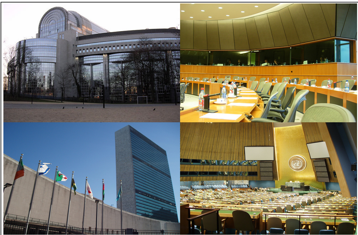
Figura 2: Alto: Parlamento Europeu (Estrasburgo): fachada e cabines de interpretação; abaixo: ONU (Nova Iorque) fachada e plenário