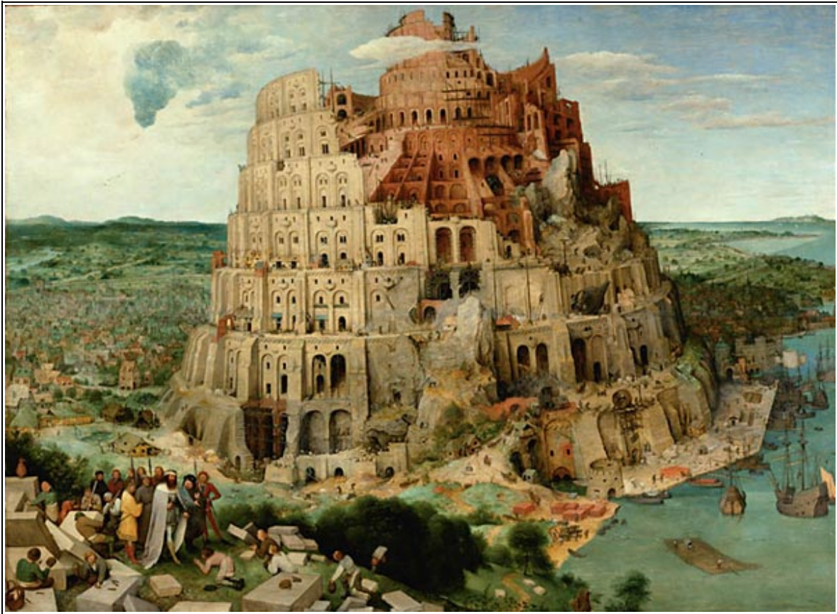
Figura 1: A Construção da Torre de Babel, de Pieter Brueghel, 1563.