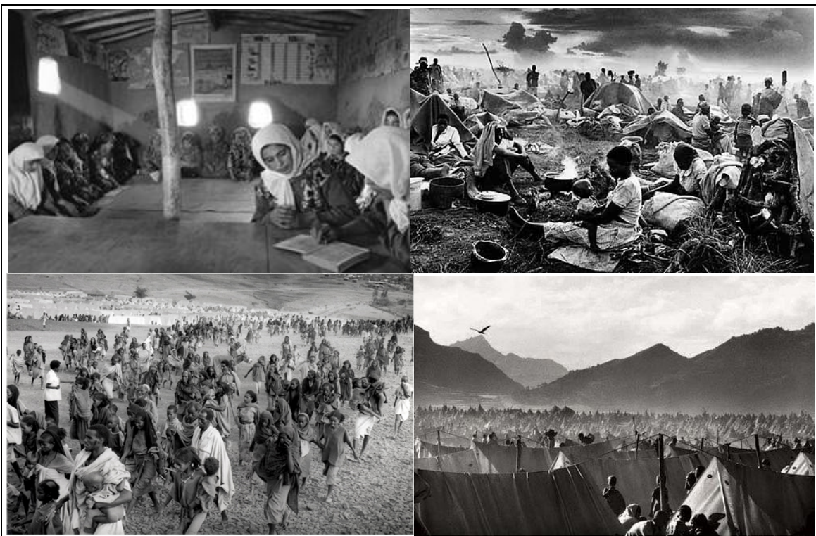
Figura 3: Refugiados – Afeganistão, Tanzânia, Ruanda e Sudão (© Sebastião Salgado)