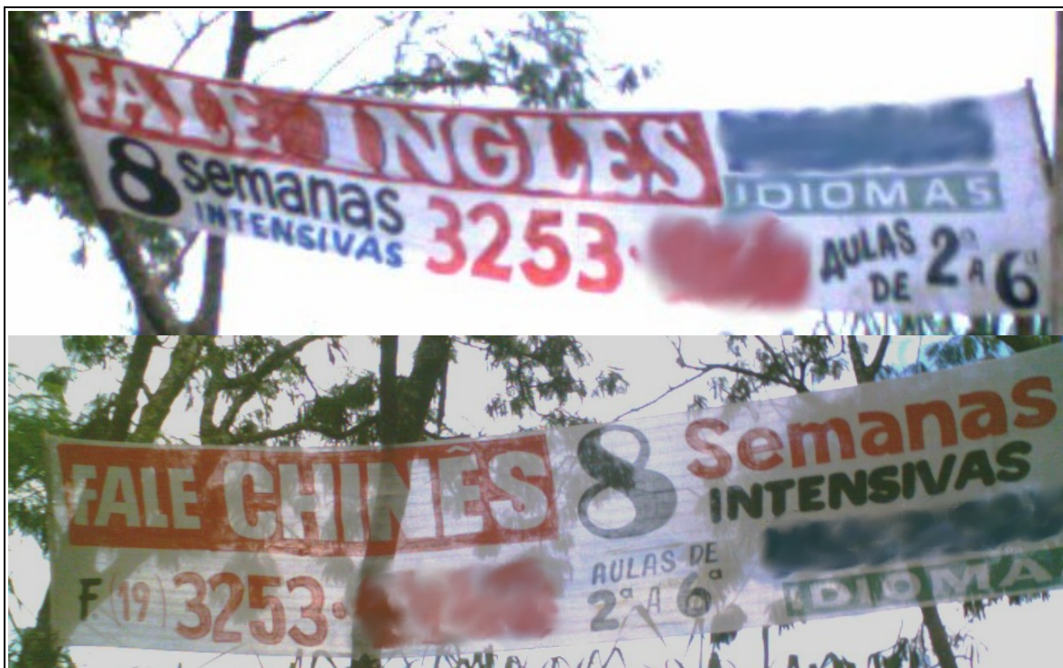
Figura 4: Falar inglês ou chinês em oito semanas... realidade ou mito?

A síndrome de Babel defende-se bem. Olhe em torno de você: as pessoas normais, que penam para utilizar uma língua estrangeira colocam-se na defensiva. Elas sentem-se inferiores. Elas vivenciam como se fosse um defeito aquilo que é a condição normal do ser humano no mundo tal como ele está atualmente organizado. Escute-as, nos casos em que um contato com o estrangeiro as faz sentir a defasagem entre os dois interlocutores: “Desculpe-me eu falo inglês muito mal” ou “Diga a ele para desculpar-me, mas eu não consegui aprender nenhuma língua estrangeira”. Nós nos desculpamos por sermos normais! É o cúmulo. Por que não deveria ser o outro a se desculpar? Com que direito espera ele que falemos sua língua?