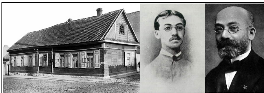
Figura 8: Zamenhof em duas fases de sua vida e a casa em que nasceu

Ele teria o direito de olhar de cima todos aqueles que, desde há um século, perdem suas apostas contra ele. Mas isso não é do seu estilo. Ele não se impõe. Ser e viver é tudo o que lhe basta. Disponível para aqueles que querem jogar o jogo. Discreto, ou mesmo invisível, para aqueles que preferem sistemas mais custosos, mais complicados e mais injustos. Só um pouco entristecido porque lhe tomam com tanta freqüência por aquilo que ele não é, e porque ainda tão mal se percebe tudo aquilo que ele pode trazer, nas relações entre os povos, não somente para a amizade e para a facilidade, mas também para a justiça e para o respeito da dignidade lingüística de cada um.