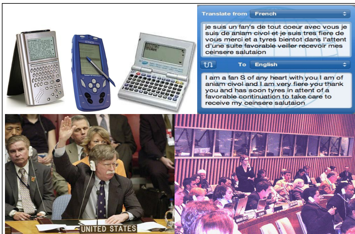
Figura 6: Traduções: de bolso, automática e simultânea.

profissionais. Quando as pesquisas atuais, nas quais se devoram milhões, tiverem chegado ao fim, se perceberá que, uma vez que o trabalho de detetive terá que ser feito de toda maneira, a informatização não terá feito ganhar nos serviços de tradução mais do que uma ou duas horas por dia no máximo. Será que o resultado vale o esforço?